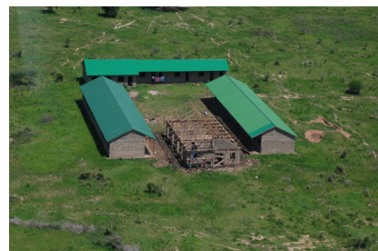
Luchtfoto school juli 2011

Zoals we al in de vorige nieuwsbrief konden berichten is onze school inmiddels gebouwd. In totaal staan er nu vier gebouwen in Cuey Machar, waarin de leslokalen, kantine, bibliotheek, laboratoria en kantoren zullen worden gehuisvest. CMSF Nederland is zich daarom nu aan het richten op de tweede fase van ons project; de afwerking van de gebouwen en de inrichting van de school. Doordat de prijzen erg gestegen zijn in Zuid-Soedan, hopen wij begin 2013 het eerste deel van deze fase te kunnen realiseren. In de tussentijd zullen wij het benodigde geld inzamelen.