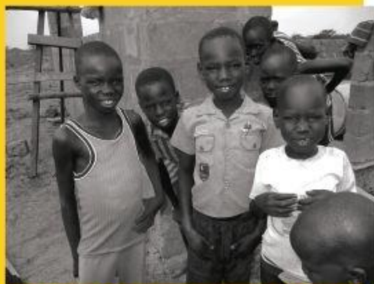
De lokale kinderen, met op de achtergrond de school die voor hen gebouwd wordt.

Het wordt tijd dat de schooljeugd van Zuid-Soedan na het basisonderwijs ook de mogelijkheid wordt geboden om middelbaar onderwijs te volgen, dat ze zich kunnen ontwikkelen en dat ze hun dromen over een betere toekomst kunnen waarmaken.