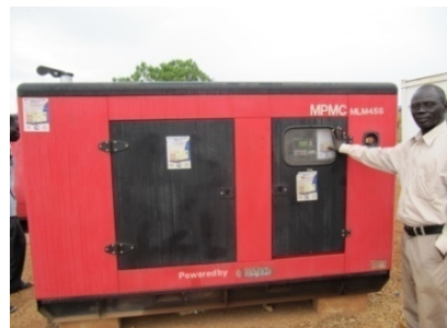
De stroomaggregaat in kwestie...

CMSF heeft in 2009 een aanvraag gedaan bij de Eureko- Achmea Foundation voor een financiële bijdrage voor de aanschaf van een aggregaat. Deze stroomvoorziening heeft de school nodig om succesvol te kunnen functioneren. CMSF heeft eind 2009 bericht gekregen dat de aanvraag werd gehonoreerd. Met het geld dat Eureko Achmea beschikbaar heeft gesteld is in Soedan inmiddels een aggregaat gekocht. Deze is in maart 2010 bij de school afgeleverd en zal binnenkort worden gebruikt bij het maken van het schoolmeubilair door de inwoners van Cuey Machar.