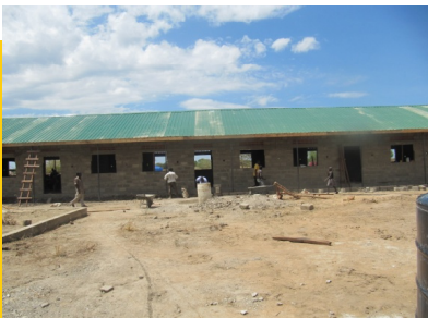
'Groene daken voor het schoolgebouw in Cuey Machar, april 2010.'