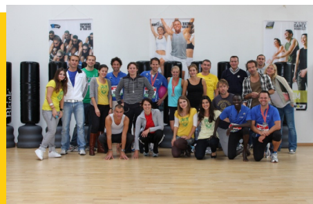
Dam tot Dam-team 2009

Op 19 september 2010 is het weer zover: de Dam tot Damloop! De damloop is een gigantisch hardloopevenement waaraan CMSF in 2009 met een team heeft deelgenomen onder het motto: 'Van Dam tot Soedan'. Destijds is er door de inzet van bekende en minder bekende Nederlanders veel geld ingezameld voor de middelbare school in Zuid-Soedan. Ook dit jaar wil CMSF weer meelopen. Helaas bleek het aantal aanmeldingen voor het evenement de aantal beschikbare startbewijzen ruimschoots te overtreffen. Deelname lijkt daarmee onzeker... Er wordt echter alles aan gedaan om in de volgende nieuwsbrief toch melding van een geslaagde deelname te kunnen maken.