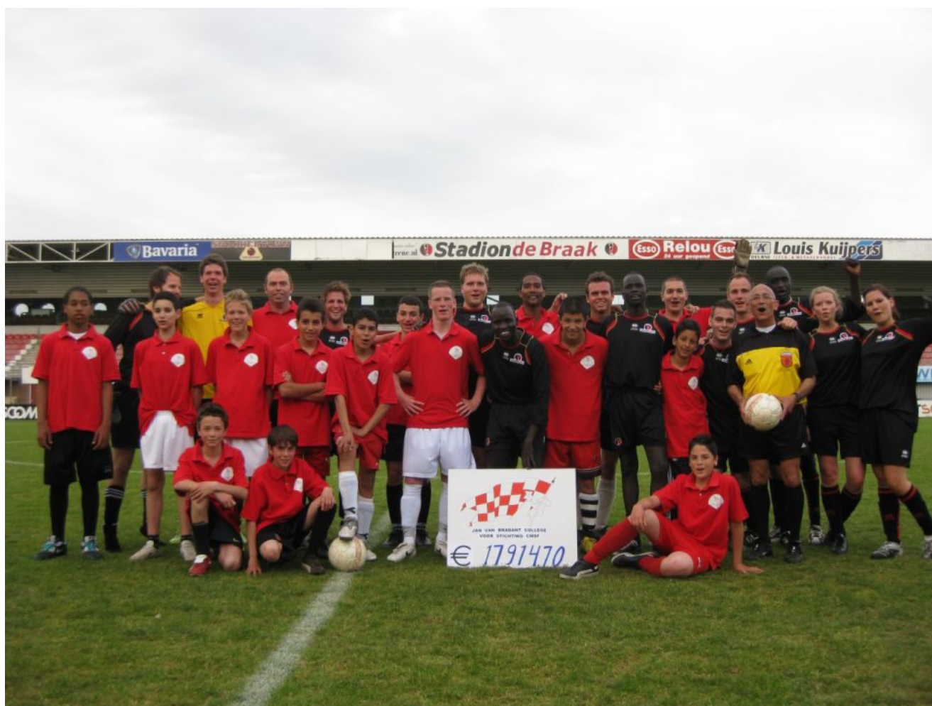
Beide voetbalteams in het stadion van Helmond Sport.

Ook het Damstede College uit Amsterdam heeft in het schooljaar 2009- 2010 actie gevoerd voor CMSF. Het geld dat is binnengehaald met deze activiteiten stroomt nog altijd binnen bij deze middelbare school. CMSF hoopt dan ook in de volgende nieuwsbrief melding te kunnen maken van het ingezamelde bedrag!