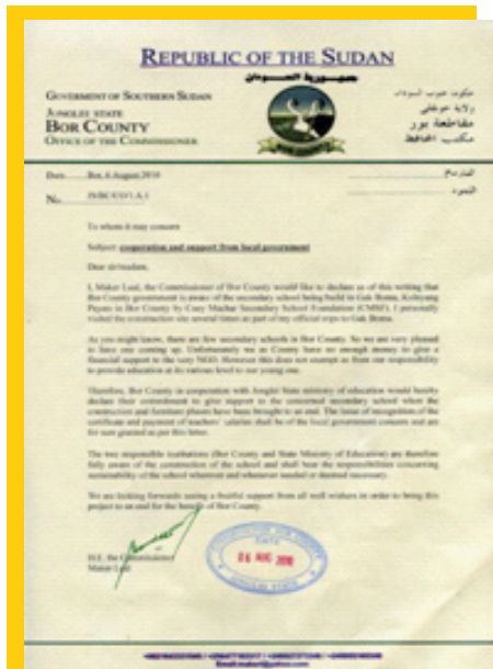
De betreffende brief uit Soedan.

Enkele weken geleden bereikte een belangrijke brief het postadres van CMSF. De lokale overheid van Zuid-Soedan zegt in de brief toe de school en de daar af te geven diploma's te zullen erkennen. Ook zal in de toekomst worden zorggedragen voor de aan de leraren uit te keren salarissen. Daarnaast verklaart de burgemeester blij te zijn met de komst van onze middelbare school. Middelbare scholen zijn hard nodig in Soedan; een bevestiging van de visie die CMSF in Nederland uitdraagt!