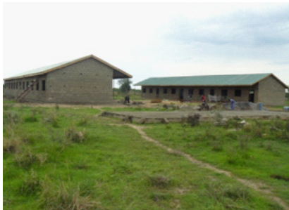
Foto van de bouw, zomer 2010.

De bouw van de school in Soedan ligt momenteel redelijk stil door het regenseizoen. Door de regen is het vervoer van de materialen erg moeilijk, aangezien de wegen vol modder liggen, waardoor de vrachtwagens er niet overheen kunnen rijden. Gelukkig ligt er op de bouwplaats nog voldoende materiaal om rustig verder te bouwen. Ten tijde van de laatste nieuwsbrief was het eerste schoolgebouw geheel klaar en was de tweede vleugel al grotendeels af. Momenteel is de tweede vleugel ook helemaal af, compleet met dak, en zijn de funderingen voor de derde en vierde vleugel gelegd. De twee vleugels die nu helemaal af zijn worden in de toekomst gebruikt als klaslokalen. De andere twee vleugels worden onder andere als aula, directiekantoor en administratiekamer gebruikt. Inmiddels wordt er binnen CMSF nagedacht over hoe het resterende bedrag voor de bouw van de school kan worden ingezameld. Maar ook denken we al aan de volgende stappen, namelijk de inrichting, de water- en sanitaire voorzieningen en het verzorgen van het onderwijs.